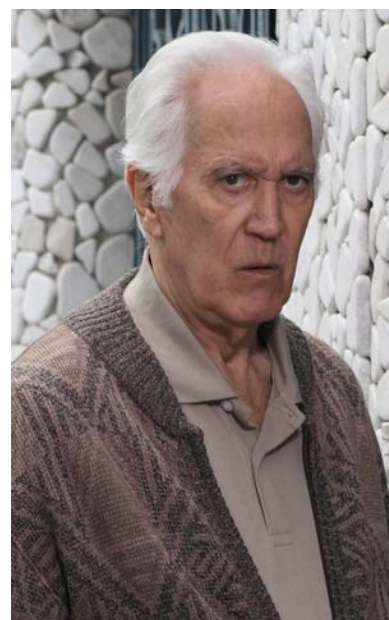
La colaboración especial de Federico Luppi En el rol de Víctor