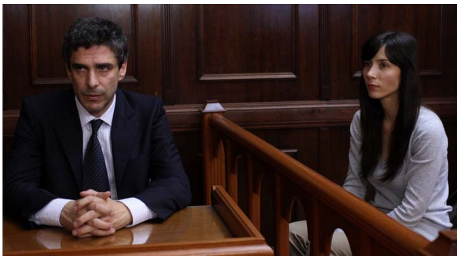
Leonardo Sbaraglia y Bárbara Goenaga